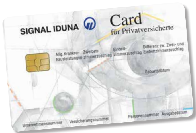
← SIGNAL IDUNA Card – Die Karte für Privatversicherte.

SIGNAL IDUNA Krankenversicherte erhalten für die Behandlung in Deutschland die Card für Privatversicherte. Beim Arzt oder Zahnarzt weist Sie diese Karte als Privatversicherten aus. Im Krankenhaus genügt es die Karte vorzulegen und schon ist die finanzielle Abwicklung der allgemeinen Krankenhausleistungen geregelt.