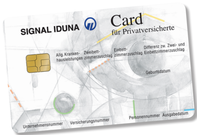
↖ SIGNAL IDUNA Card – Die Karte für Privatversicherte.

SIGNAL IDUNA Krankenversicherte erhalten für die Behandlung in Deutschland die Card für Privatversicherte. Beim Arzt oder Zahnarzt weist Sie diese Karte als Privatversicherten aus. Im Krankenhaus genügt es die Karte vorzulegen und schon ist die finanzielle Abwicklung der allgemeinen Krankenhausleistungen geregelt.